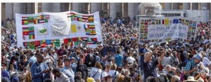
Il Romerò, Piazza

Mentre 180 migranti sbarcano a Lampedusa e 40 in Sardegna, Papa Francesco sbalza al mondo di non chiudere gli occhi, di non escludere nessuno. Un monito anche ai cristiani che non possono essere «indifferenti di fronte al dramma