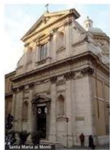
Santa Maria ai Monti